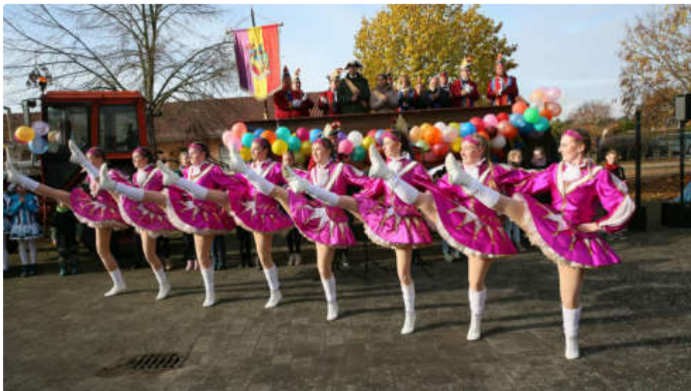
Die Prinzengarde des Karneval Club Dabel beim Karnevalauftakt am 11.11. 2023

Dabel hinein! Der Narrenruf wird ab 11. November wieder in Dabel zu hören sein. Was an diesem Tag geplant ist und wo es Tickets für die Gala gibt, lesen Sie hier.